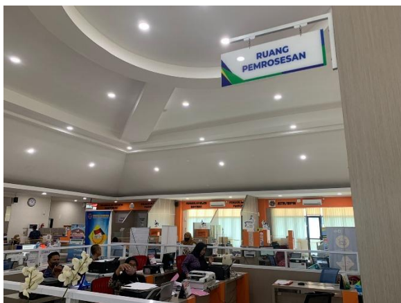
BACK OFFICE/RUANG PEMROSESAN